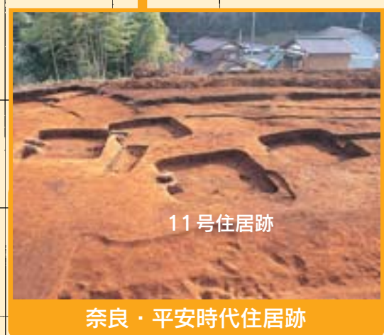
奈良・平安時代住居跡