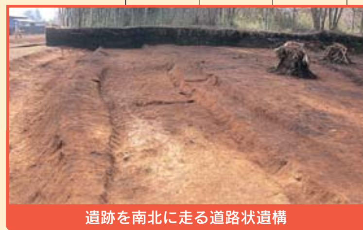
遺跡を南北に走る道路状遺構