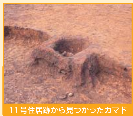
11号住居跡から見つかったカマド