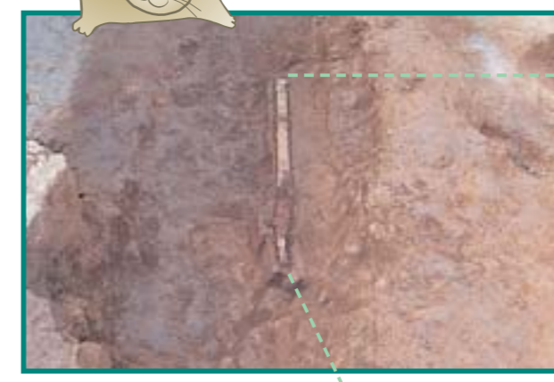
【写真1】直刀出土状況

道作古墳群は印西市小林字馬場2824-5他に位置し、成田線小林駅から西方に1.5kmほど離れた桜の名所として知られる小林牧場の近くにありま。