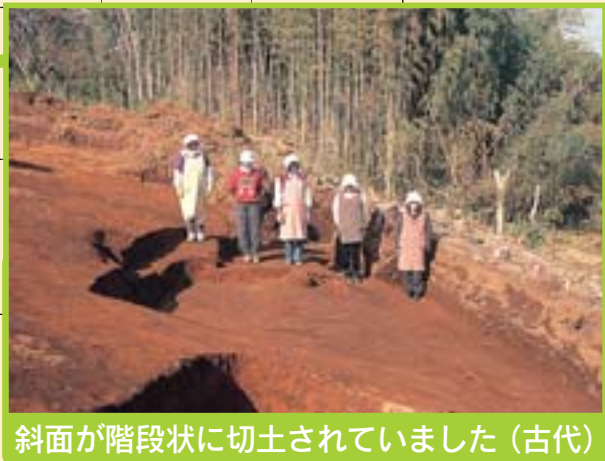
斜面が階段状に切土されていました(古代)