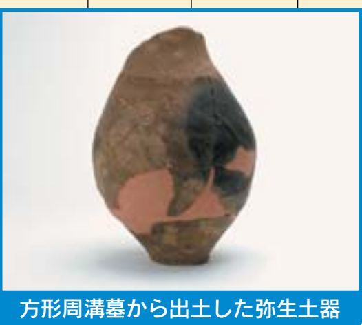
方形周溝墓から出土した弥生土器