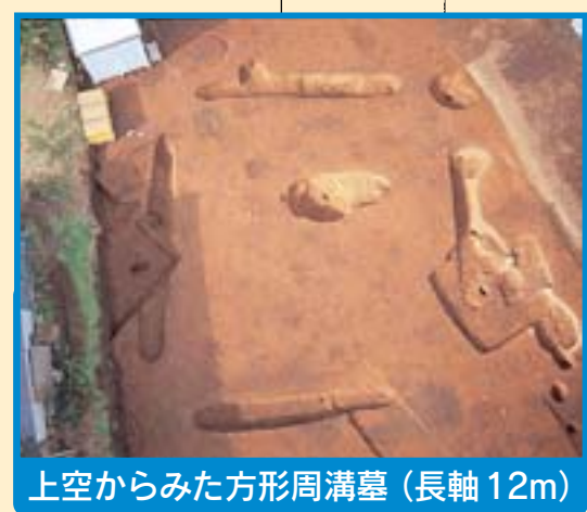
上空からみた方形周溝墓(長軸12m)