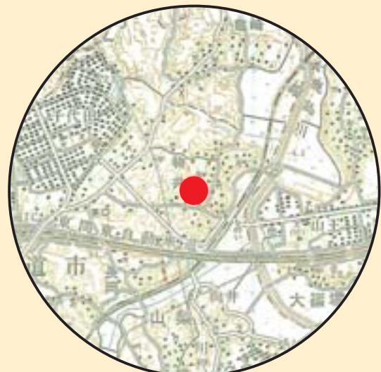
馬場No.1 遺跡位置図 (S = 1/50,000)