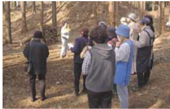
五十石込跡現地説明会

交通の便が不便なところであるにもかかわらず、熱心な考古学ファンが大勢訪れ、保存状況のよい大規模な掘込跡に驚きながら解説員の説明に真剣に耳を傾けていました。