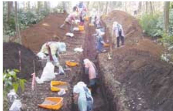
井野長割遺跡調査風景

佐倉市井野長割遺跡において縄文時代後・晩期の大規模な盛土遺構や斜面を埋め立てた痕跡が発見されました。特に埋め立ての痕跡は大規模なもので、全国的に見ても類例は少ないようです。