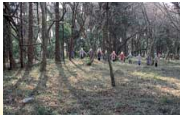
井野長割遺跡盛土遺構